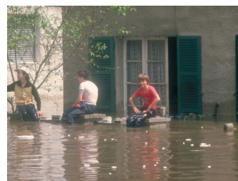
Inondation dans le quartier de Groussay (78) ; 1982