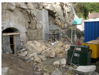
Confortement de falaises à Chars (95)