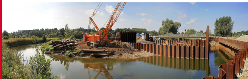
Travaux de prévention du risque inondation : site d'écrêtement des fortes crues de l'Oise de Proisy (02) réalisé par l'Entente Oise Aisne et achevé en 2009.

Le FPRNM peut uniquement financer des actions de prévention des risques naturels dits « majeurs ». En Ile-de-France, cela concerne les inondations, les mouvements de terrain (cavités souterraines, glissements de terrain...).