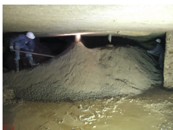
Comblement de carrière (75)

ticle 103 de la loi de finances pour 2013 n°2012-1509 du 29/12/2012 stipule que dans la limite de 55 M€ par an, le FPRNM peut contribuer au financement d'études et travaux ou équipements de prévention ou de protection contre les risques naturels dont les collectivités territoriales ou leurs groupements assurent la maîtrise d'ouvrage, dans les communes couvertes par un plan de prévention des risques prescrit ou approuvé. Ces dispositions s'appliquent également aux actions de prévention des risques naturels réalisées sur le territoire de communes qui ne sont pas couvertes par un plan de prévention des risques naturels prescrit ou approuvé, mais qui bénéficient à des communes couvertes par ce type de plan.